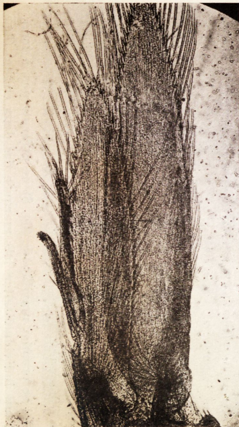
Fig. 2. — Pléopode II du mâle