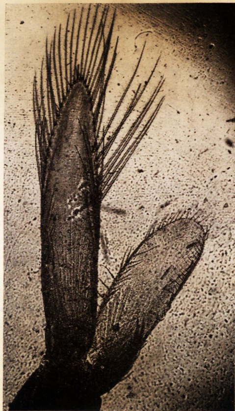
Fig. 1. — Pléopode 1 du mâle