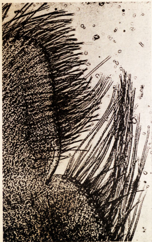
Fig. 4. — Mxp-I : soudure des endites