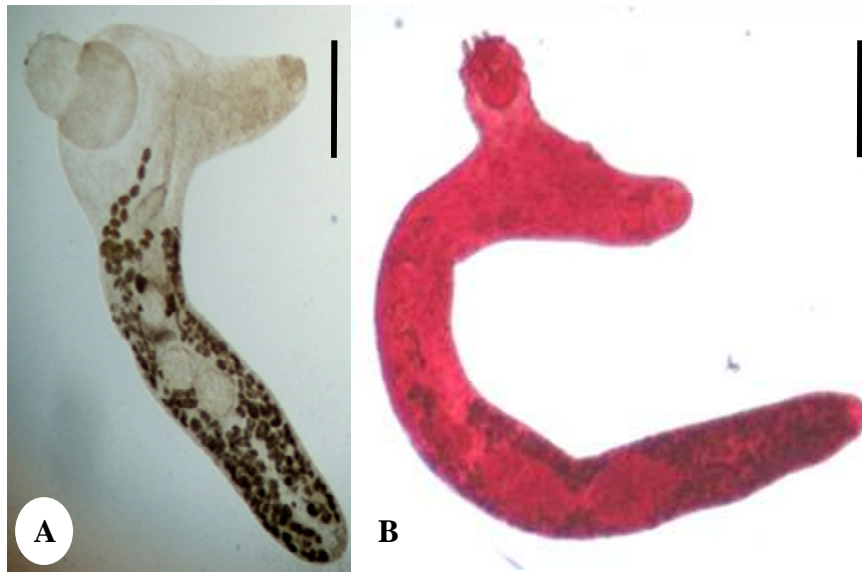
Figure 2: Poracanthium furcatum

A: « in vivo », B: « in toto » (échelle= 0,5mm)