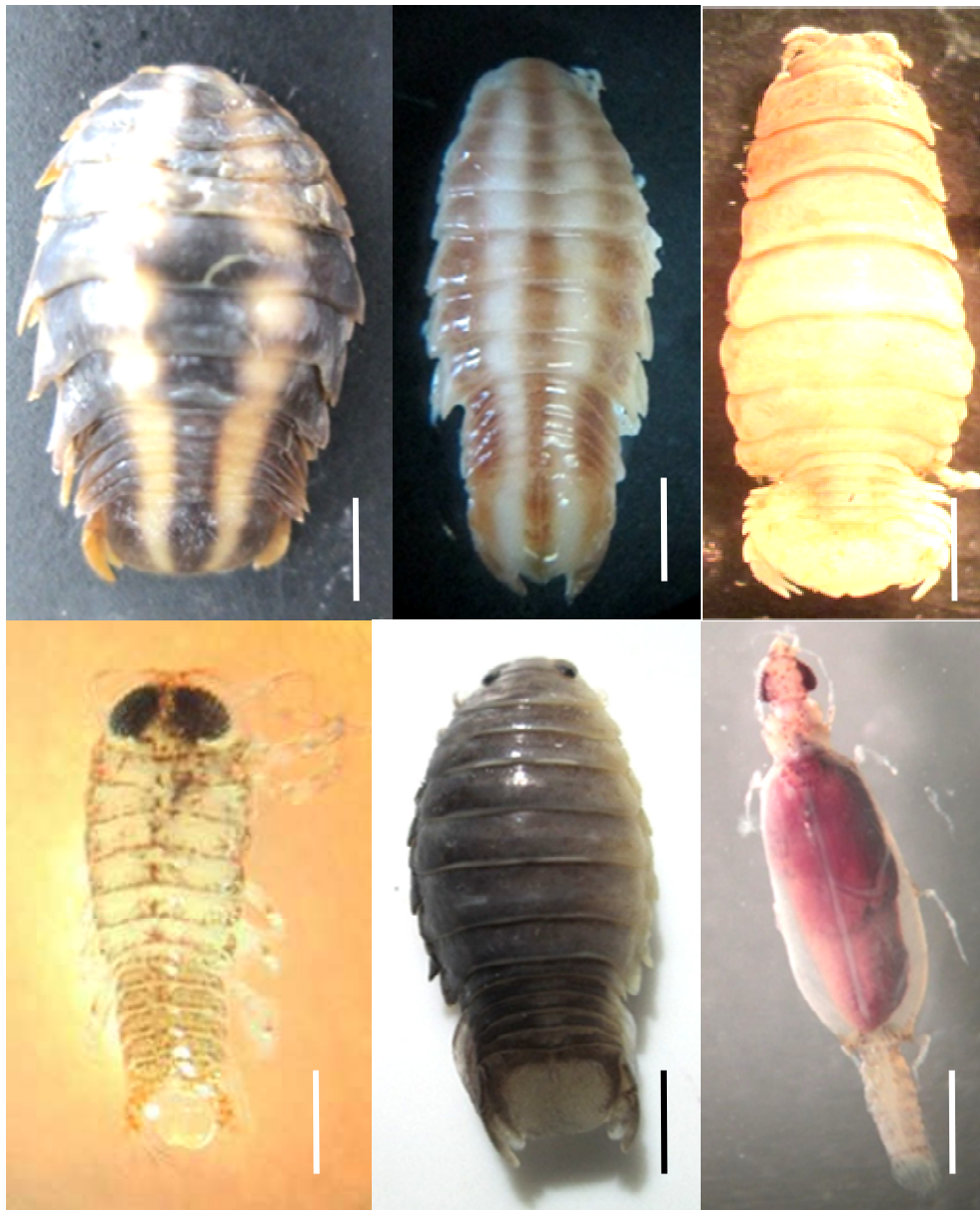
Figure 1: Isopodes parasites des poissons Scorpaenidae.

En Tunisie, Gnathia sp. a été signalée chez les Trachinidae par Azizi et al. , (2017). Nous la signalons pour la première fois chez les trois espèces de Scorpaenidae en Tunisie.