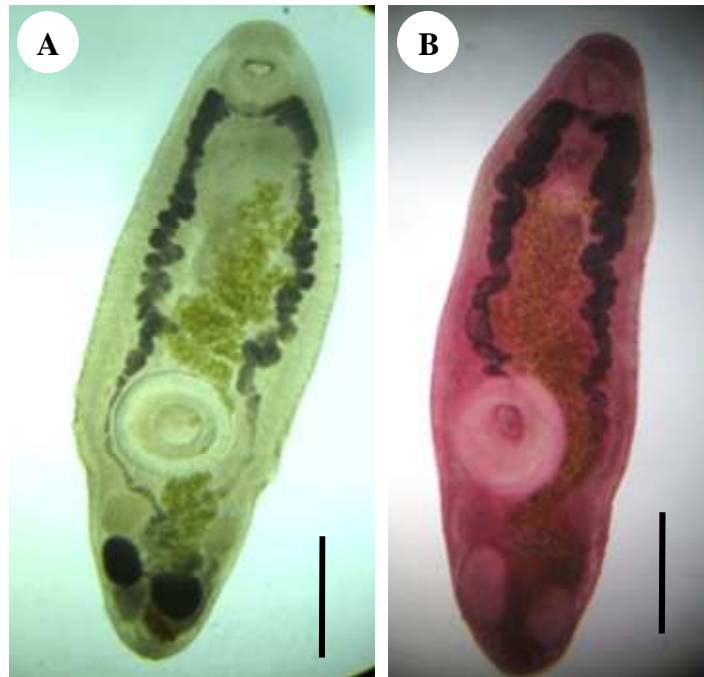
Figure 4: Derogenes varicus A: « in vivo », B: « in toto » (échelle= 0,5mm)

Nous la signalons pour la première fois chez Scorpaena porcus des côtes tunisiennes en provenance de Bizerte.